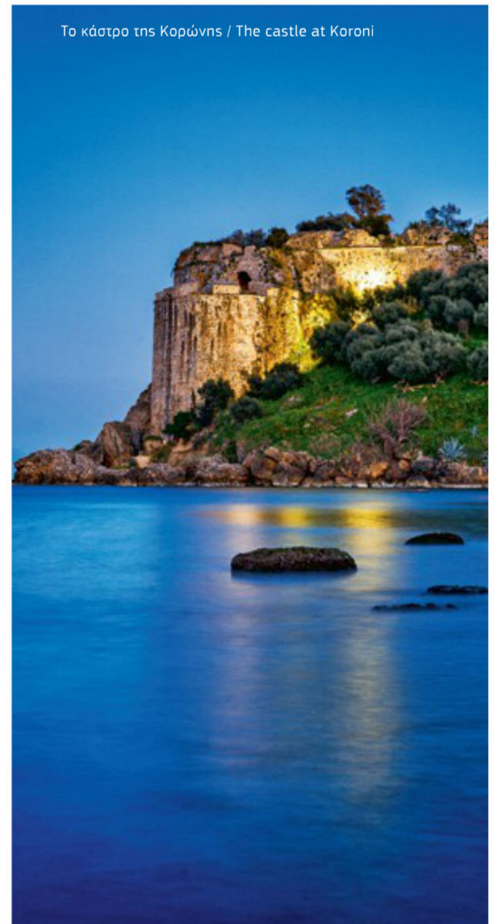
Το κάστρο της Κορώνης / The castle at Koroni

city centre. I would visit the Railway Park, head up pedestrianised Aristomenous Street, with its marvellous neoclassical buildings, and end up in the heart of the old city centre, where a small Byzantine church, Agion Apostolon, is located. I would leave the long and steep ascent to the city's castle for last.