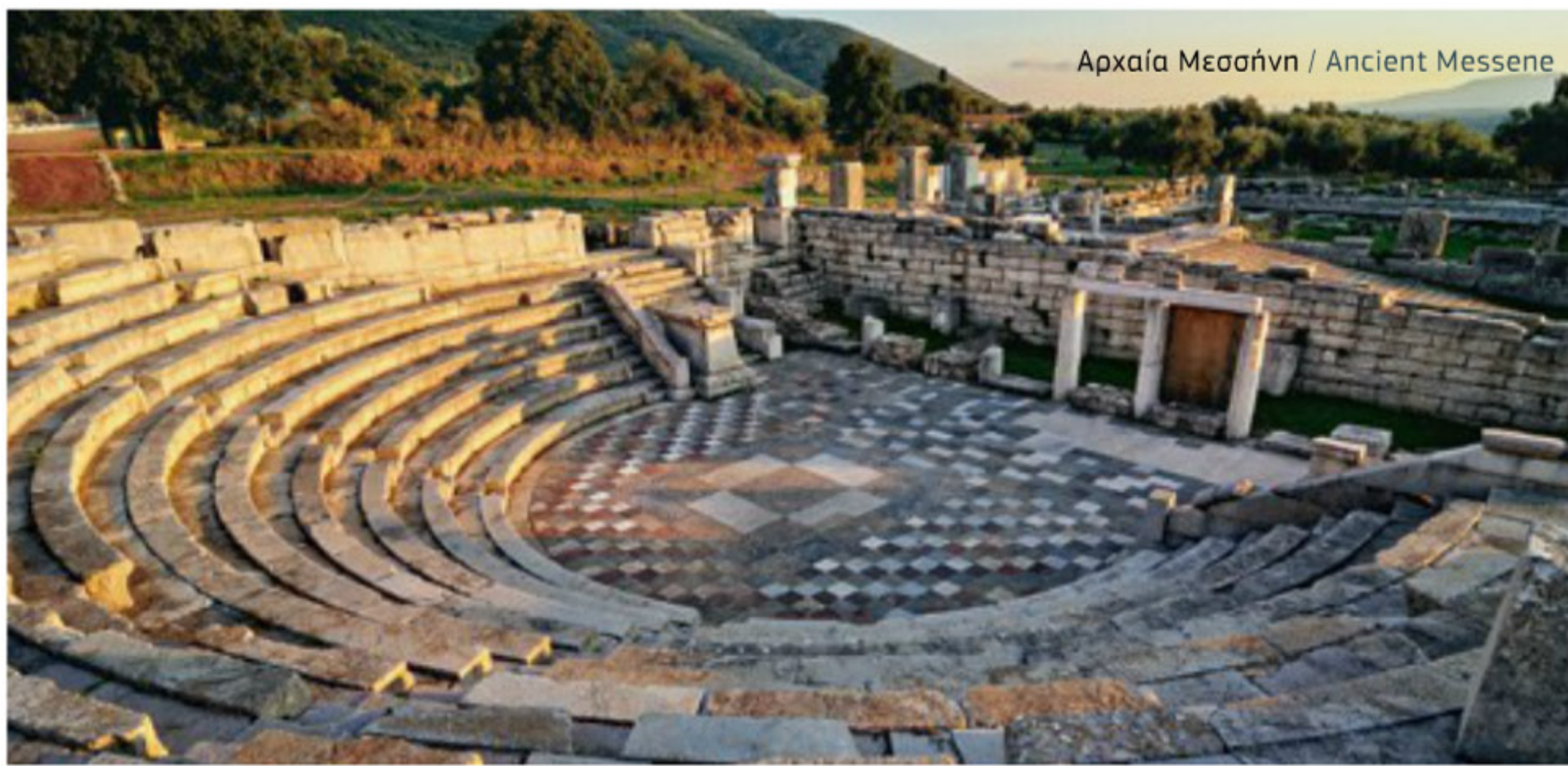
Αρχαία Μεσσήνη / Ancient Messene