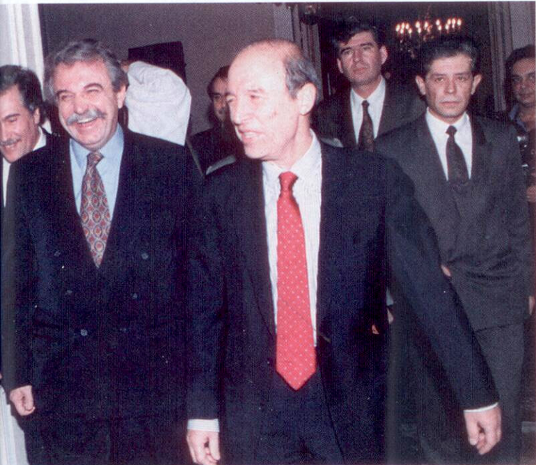
Ο Σταύρος Μπένος στη ορκωμοσία του ως Υπουργός Πολιτισμού δίπλα στον κ. Κ. Σημίτη

Πώς βλέπετε το μέλλον σας στην Αθήνα με δεδομένη την δυσκολία της Β' ε